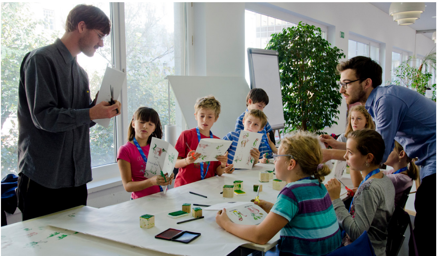
Figures 9, 10. "Come on Kids" workshops, held at various cultural venues and in public spaces in cities including Bolzano, Venice, Milan, Mantova and Rovereto.