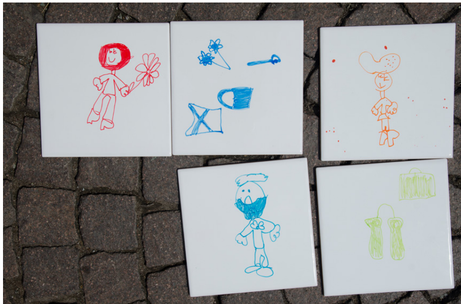
Figure 11. “Come on Kids” workshops, held at various cultural venues and in public spaces in cities including Bolzano, Venice, Milan, Mantova and Rovereto.

Negli anni recenti il sistema educativo dominante nella parte nord-occidentale del mondo sono stati sottoposti a rinnovata critica, e vari report e studi hanno evidenziato la necessità di riorganizzare l'apprendimento ponendo maggiore attenzione allo sviluppo delle abilità creative e immaginative, costruendo ambienti ed esperienze di apprendimento in cui le prospettive e i linguaggi individuali siano riconosciuti e sostenuti. Vari appelli sono stati avanzati anche per sviluppare più strette relazioni fra le scuole e altri contesti e istituzioni di apprendimento informale già impegnati nell'offerta culturale e educativa. Nel quadro delle sfide e dei cambiamenti attuali, il design può avere un ruolo cruciale per innovare le esperienze di apprendimento creativo a diversi livelli e scale. Questa direzione merita di essere esplorata e valutata attraverso attività di ricerca e sperimentazione multidisciplinari, a cavallo fra scienze della formazione e discipline del progetto.