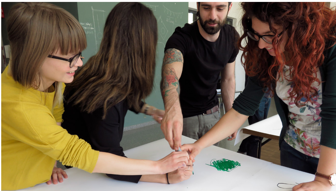
Figures 3, 4. Studio courses led by Giorgio Camuffo, dedicated to the experimentation of the encounter of design and pedagogy, involving students along with designers