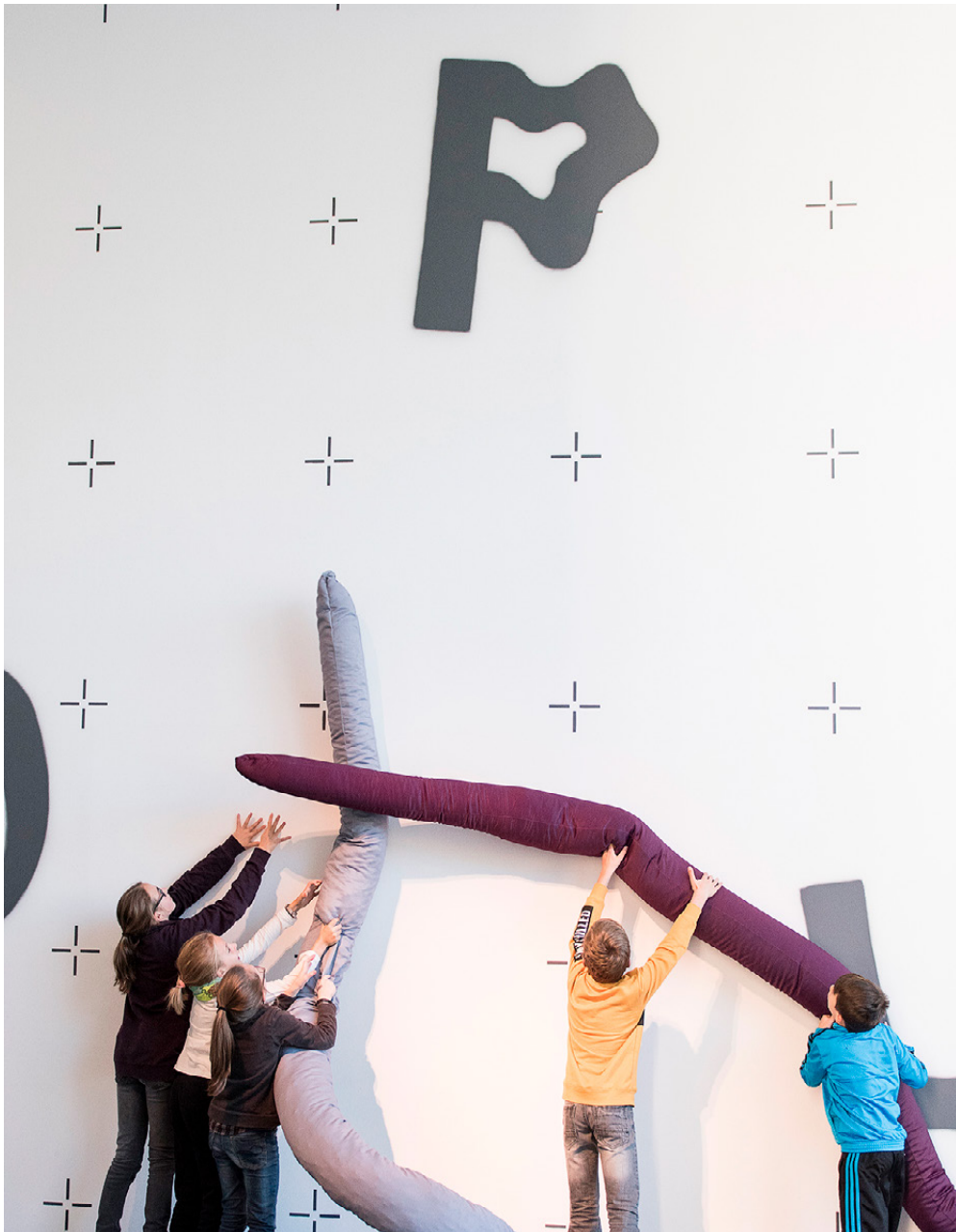
Figure 19. "Octopus" a kids' space at Museion, Bolzano, conceived by students of the Interior and Exhibition Design studio course led by Roberto Gigliotti