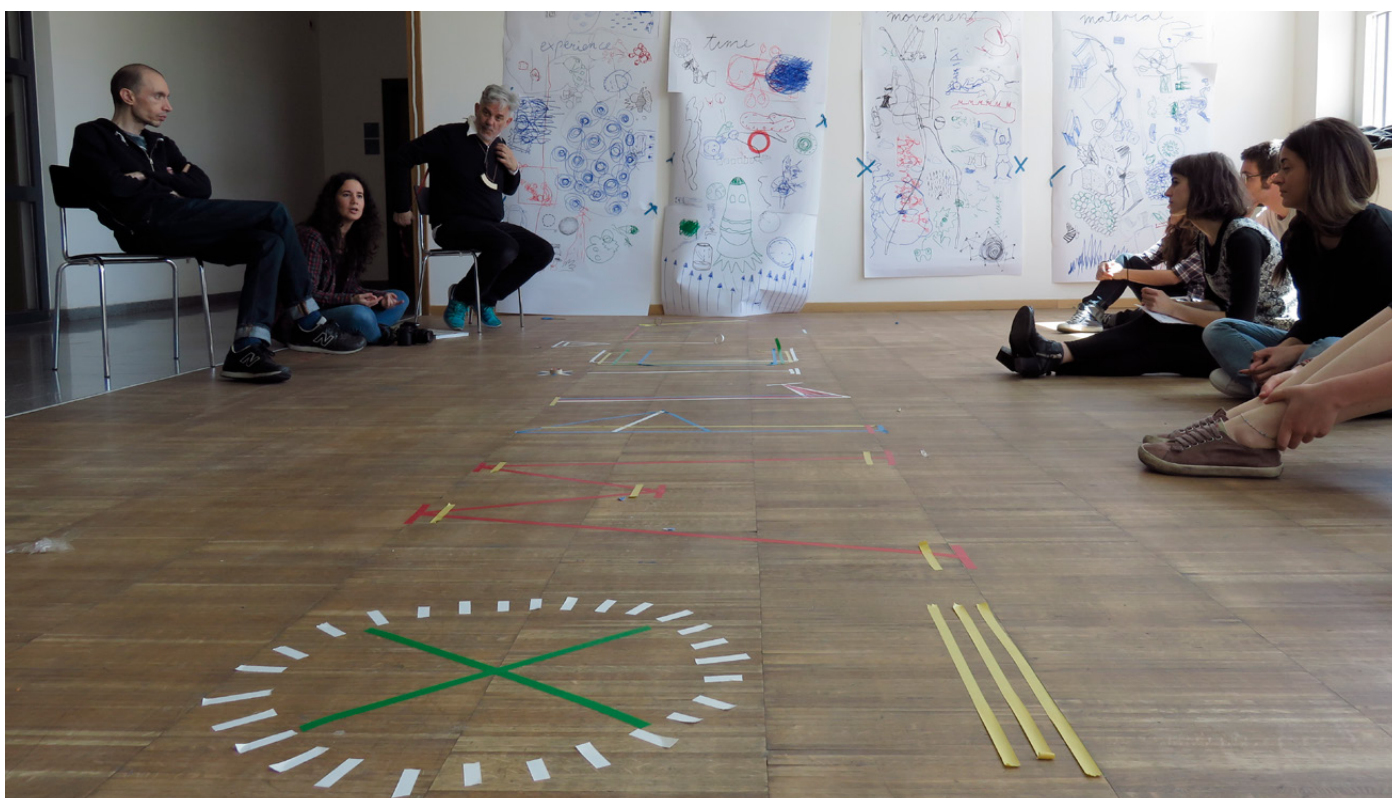
Figure 6. Studio courses led by Giorgio Camuffo, dedicated to the experimentation of the encounter of design and pedagogy, involving students along with designers

The “Come on Kids!” Initiative (already launched by Giorgio Camuffo in 2012), developed in the framework of the EDDDES project, was awarded in 2016 as an exemplary project of the Free University of Bolzano’s “Third Mission”.