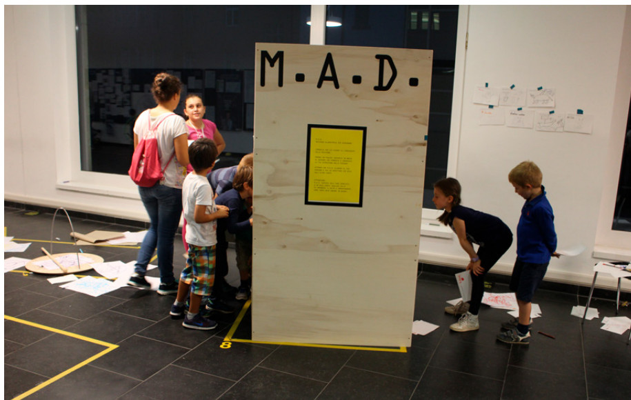
Figure 17. “Machines for drawing” workshop series

Il progetto ha incluso la organizzazione di (e la partecipazione a) numerose attività di disseminazione e di collaborazione con istituzioni culturali a Bolzano e in altre città. Fra questei una serie di attività pubbliche sotto il titolo “Come on Kids”, “Macchine per disegnare” e “Wunderfab”: laboratori e attività educative incentrate sulla comunicazione visiva e il design, ideati da studenti, ricercatori e designer e proposti al pubblico, in particolare bambini e ragazzi, in varie sedi culturali e negli spazi pubblici a Bolzano, Milano, Venezia, Rovereto, Mantova.