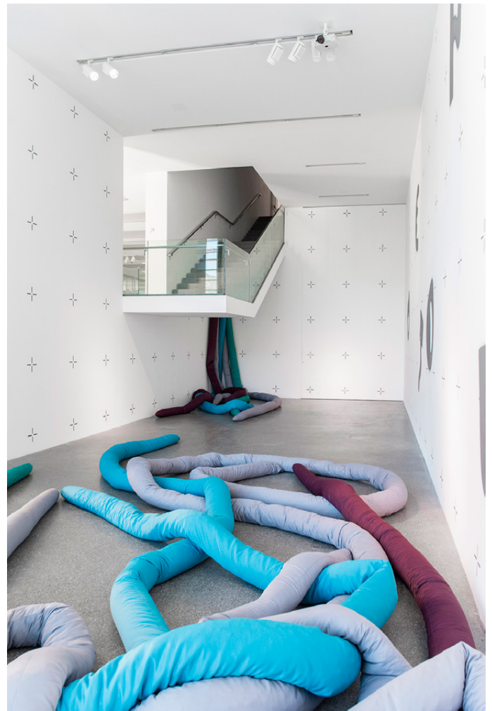
Figures 20, 21. "Octopus" a kids' space at Museion, Bolzano, conceived by students of the Interior and Exhibition Design studio course led by Roberto Gigliotti