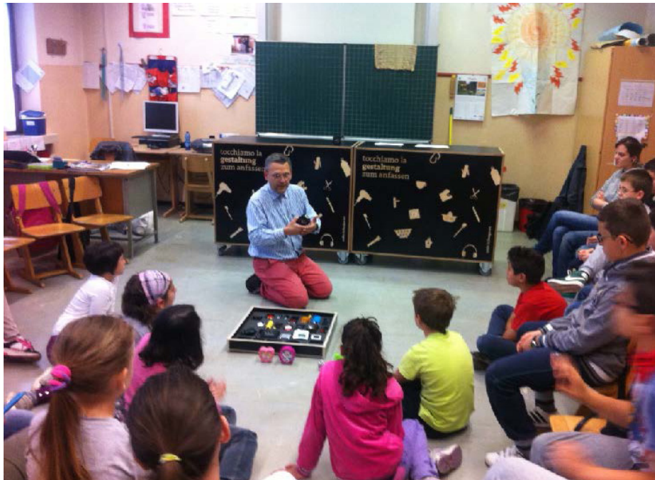
Figure 8, 9