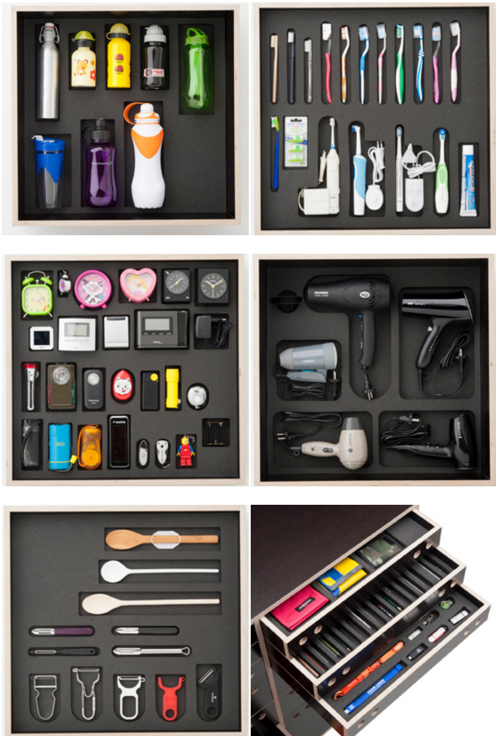
Figure 2 - 7